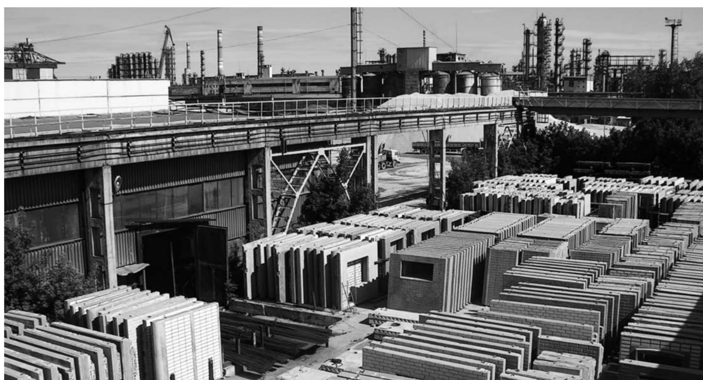
«На заводе сейчас существует не менее 150 свободных рабочих мест, и при увеличении загрузки мощностей часть уволившихся рабочих готовы вернуться», – отметил руководитель ТЗЖБИ.

Важным моментом, по мнению научно-технического совета, стал и необоснованный выбор зарубежного поставщика оборудования. «Немецкая