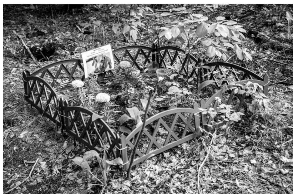
В Тольятти есть как минимум три крупных кладбища для домашних животных. Все они нелегально существуют уже много лет и находятся в лесопосадках каждого из районов города.

ных, чтобы хозяева могли достойно предать земле прах своих любимцев. В итоге никаких мер предпринято не было, и люди продолжают хоронить