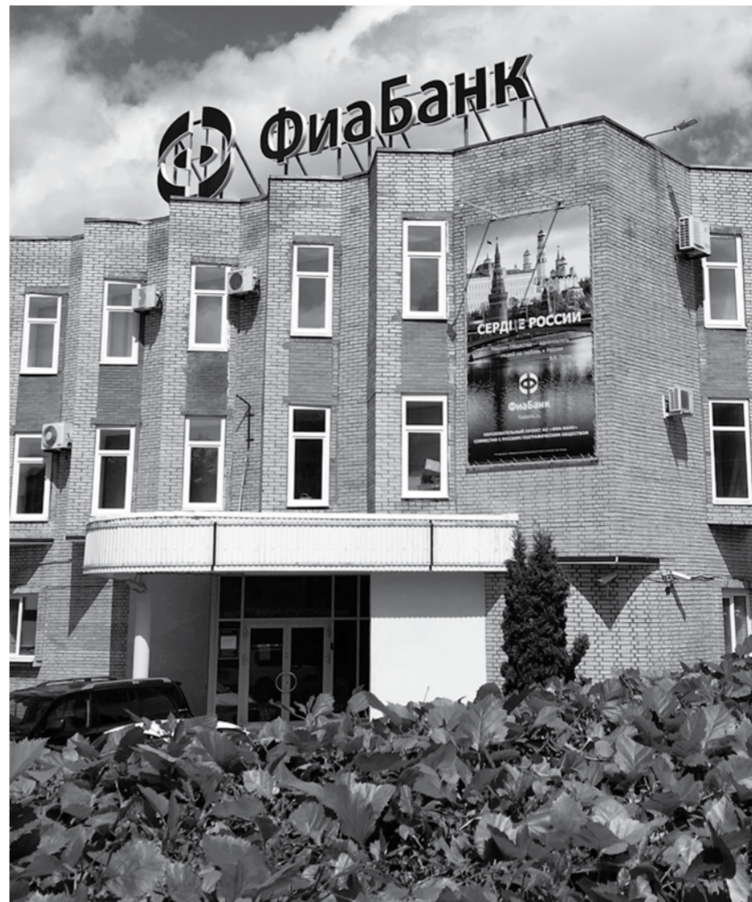
Самый крупный объект – земельный участок и нежилые помещения с имуществом по адресу: Новый проезд, 8, где ранее располагался ФиаБанк. Он оценен в 391,5 млн рублей.

зарегистрирован Эл банк. Недостроенные здания, нежилые помещения, жилые дома, гаражи, земельные участки, часть административного здания – все это