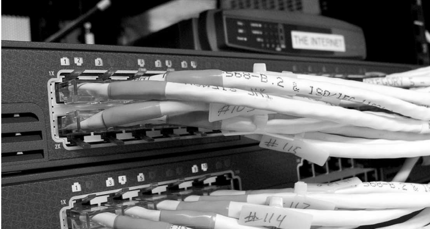
Большинство провайдеров использует FastEthernet со скоростью 3 – 100 Мбит/с. Его конкурент – GPON заявляет о скорости 100 Мбит/с, но минус GPON (небезопасность передачи данных, сложность поиска поврежденного участка при аварии, трудности с передачей широкополосного IP TV), заставляя потребителей осторожничать.

7. Отзывы клиентов компании. Этот пункт может помочь в выборе, а может и спутать все карты. Психологи знают, что один недовольный клиент не пожелает времени, чтобы написать несколько разгромных отзывов, а десять довольных клиентов промолчат. Кроме того, нередко под видом реальных абонентов отзывы оставляют специально нанятые люди: они пишут негатив в адрес конкурентов, а компания-нанимателя всячески прославляют. Однако общую тенденцию